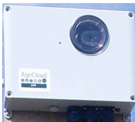
あぐりクラウド™LIGHT-R（ライト R）外観

利用者がスマートフォン（スマホ）などで手軽にハウスの環境およびカメラ画像を確認できるのが特徴。